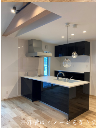
※外構はイメージとなりません